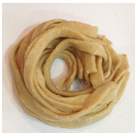
Figura 1. Massa tipo talharim contendo 25% da farinha da casca de maracujá.

A Figura 2 mostra a resposta glicêmica dos voluntários quanto ao consumo da massa tipo talharim contendo 25% de FCM, a formulação de melhor aceitação sensorial, como controle, utilizou formulação padrão contendo apenas farinha de trigo. A glicemia basal do grupo experimental foi de 93,1 \pm 5,31 mg/dL, enquanto que a do grupo controle foi de 90,55 \pm 8,95 mg/dL. Trinta minutos após o consumo, a glicemia média dos voluntários do grupo experimental foi de 97,0 \pm 9,8 mg/dL, mantendo-se constante até 120 minutos após o consumo. Esses valores foram significativamente